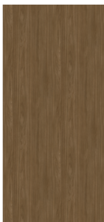
Vizualizare placă întreagă